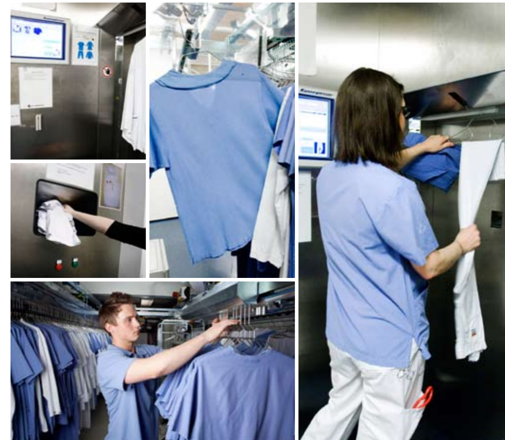
Textilias plaggdistributionssystem effektiviserar textilhanteringen och sparar pengar åt kunderna.

Plaggautomaten är som en stor garderob med en lång slinga kläder som rör sig när någon tar ut ett plagg. För användaren (vårdpersonalen) är plaggautomaten ett tvättinkast som ser ut som ett vanligt sopmedkast. Varje användare får bara ha ett visst antal textilier ute - därför är det viktigt att man kastar smutskläderna i tvätten för att få lov att ta ut nya plagg. För att få ut rena kläder drar man sitt passerkort. På en pekskärm kommer det då upp en översikt med bilder och rubriker på de plagg som är inlagda i användarprofilen. Sedan pekar man på det man ska ha och så kommer de beställda plaggen ut. Ett sjukhus har i regel flera plaggautomater för att de ska finnas så nära personalomklädningsrum som möjligt. På grund av platsbrist är plaggautomaterna ofta lokaliserade i källarplanet.