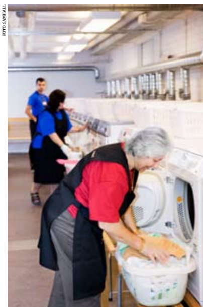
Samarbetet med Textilia ger Samhalls personal kontakt med det vanliga arbetslivet ute i samhället.

med en förfrågan om några norrländska restaurangdukar har idag inte bara växt till ett rikstäckande och lönsamt samarbete – det har även medfört ett viktigt samhällsengagemang.