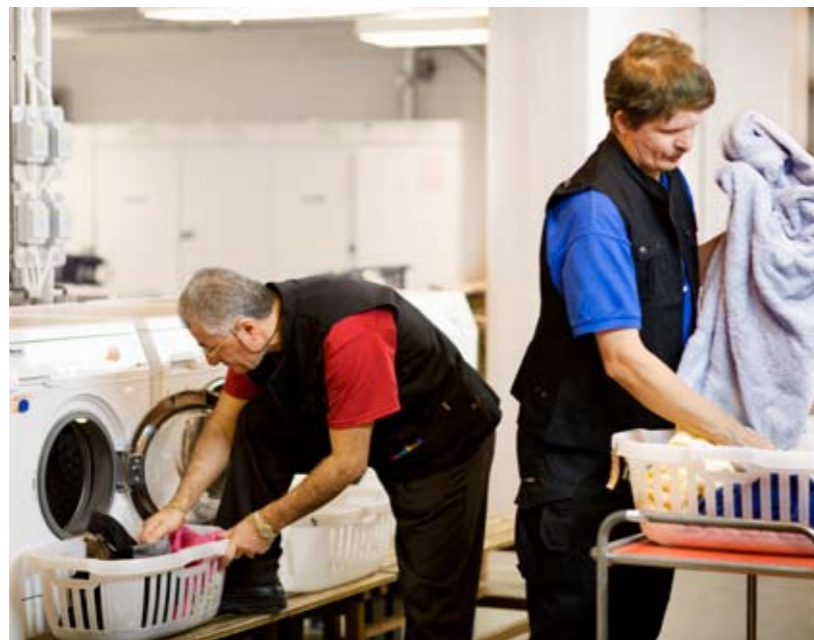
Samhall är underleverantör till flera av Textilias norrländska hotellkunder.

hela ansvaret för textilierna som de beställer, tar hand om och packar upp.