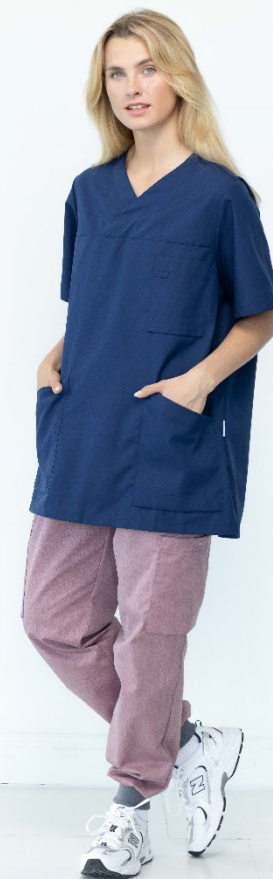
9120 Muddbyxa Pim