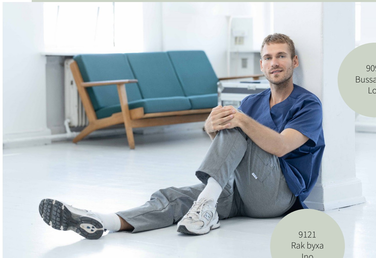
9093 Bussarong Lou