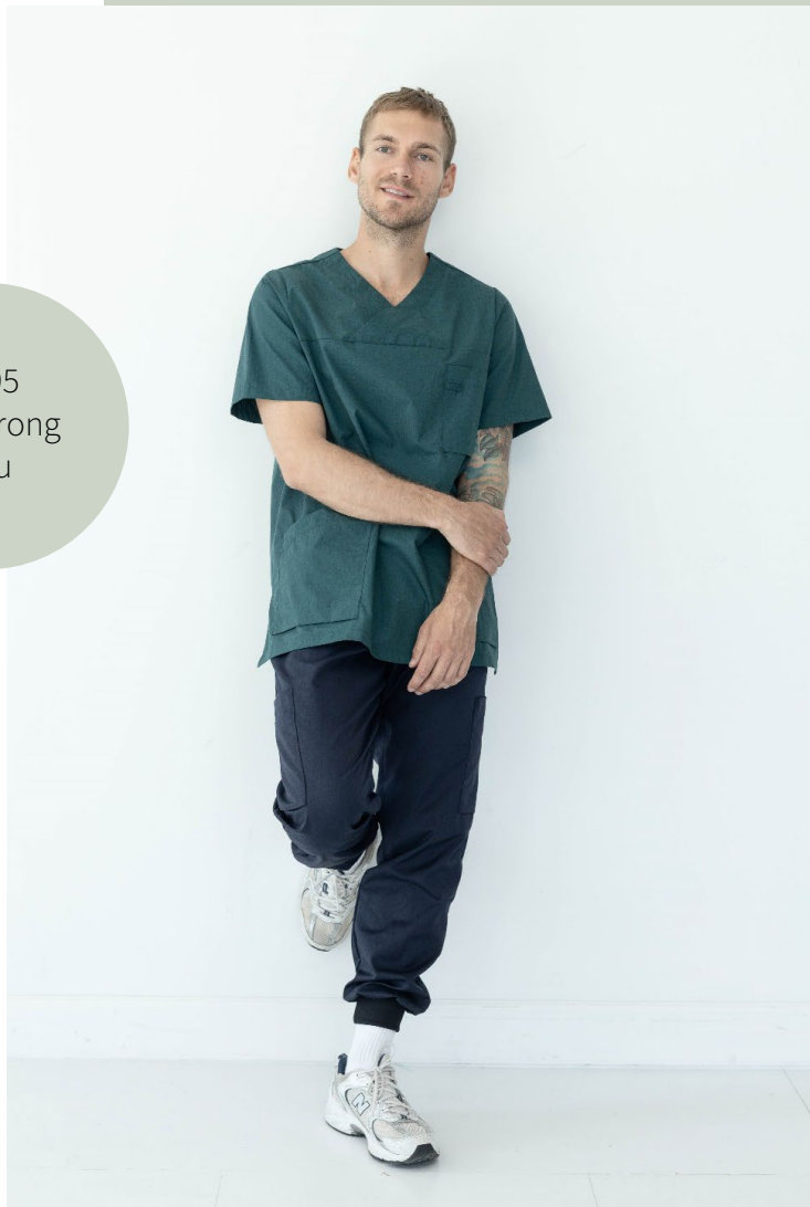
9095 Bussarong Lou