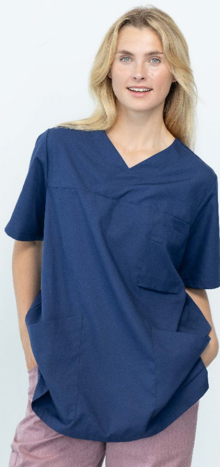
9095 Bussarong Lou tencel