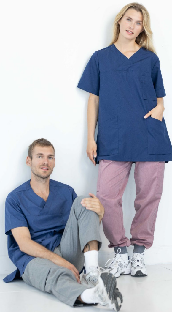
9095 Bussarong Lou tencel