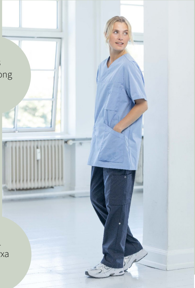
9121 Rak byxa Ino