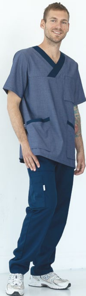
4059 Bussarong Gabrielle