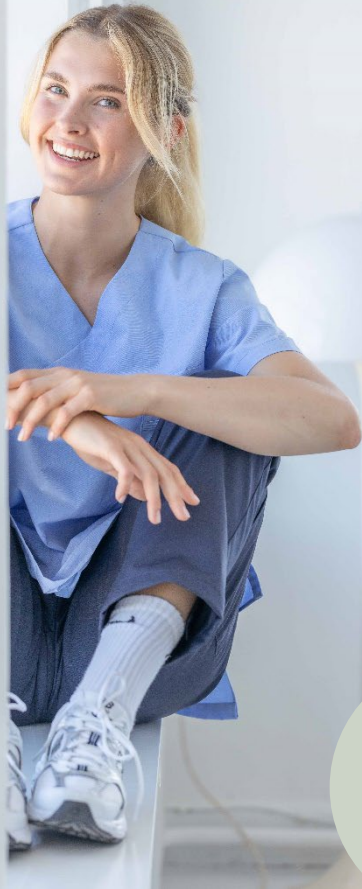
9162 Byxa linning Sasha