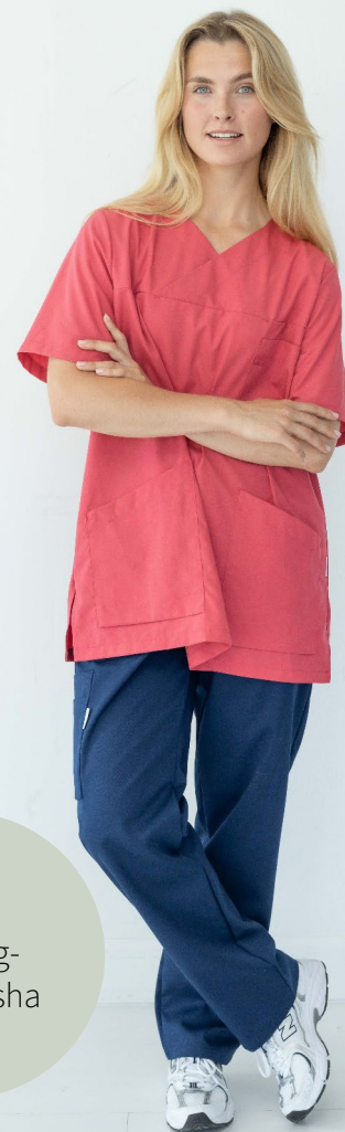
9095 Bussarong Lou Tencel