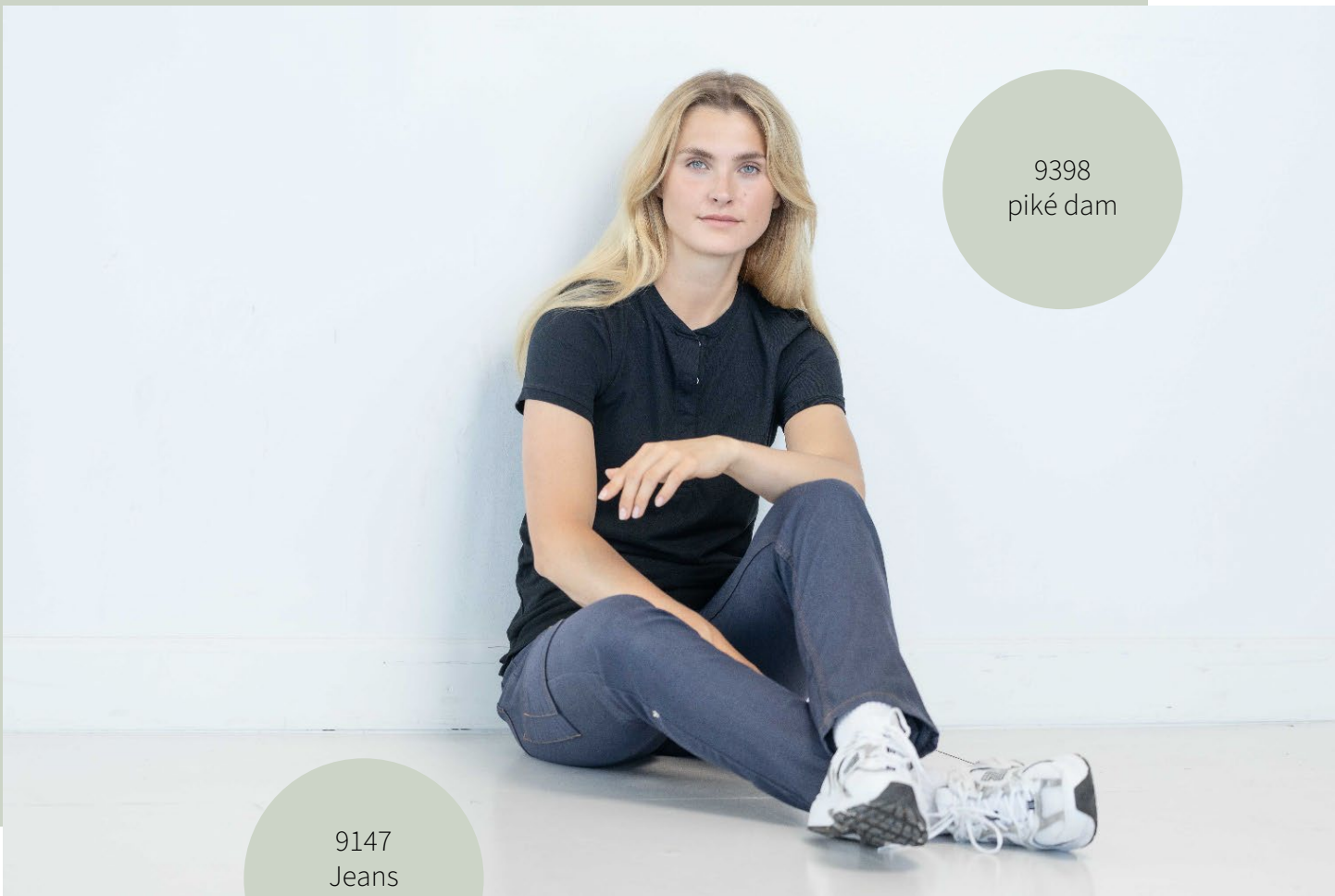
9147 Jeans stretch