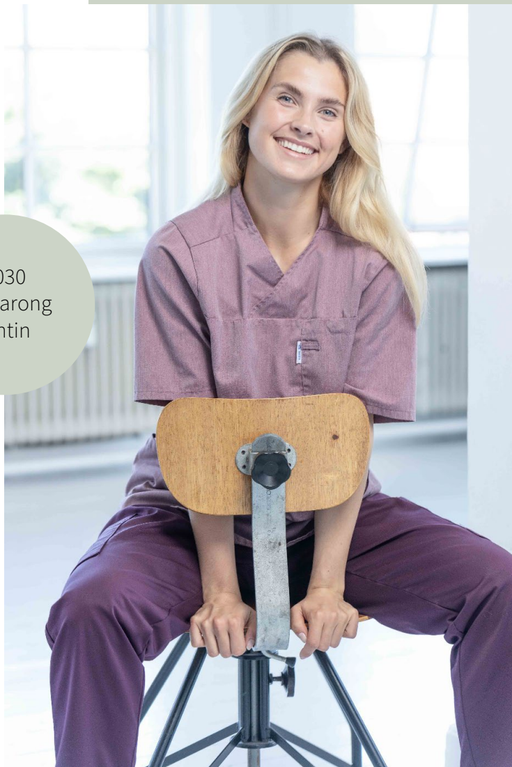
9030 Bussarong Tintin